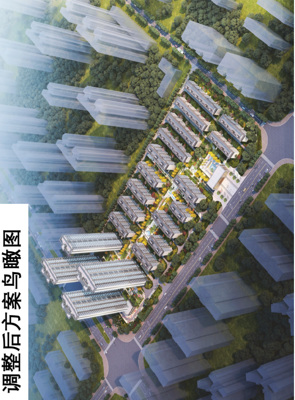
调整后方案鸟瞰图