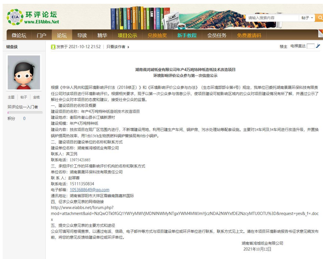
图2-1 第一次网站公示截图