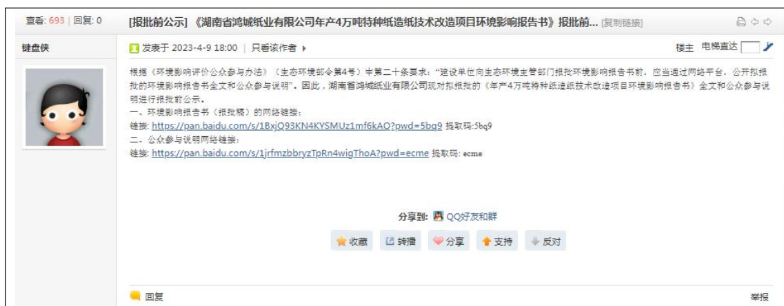
图 3-4 报批前公示