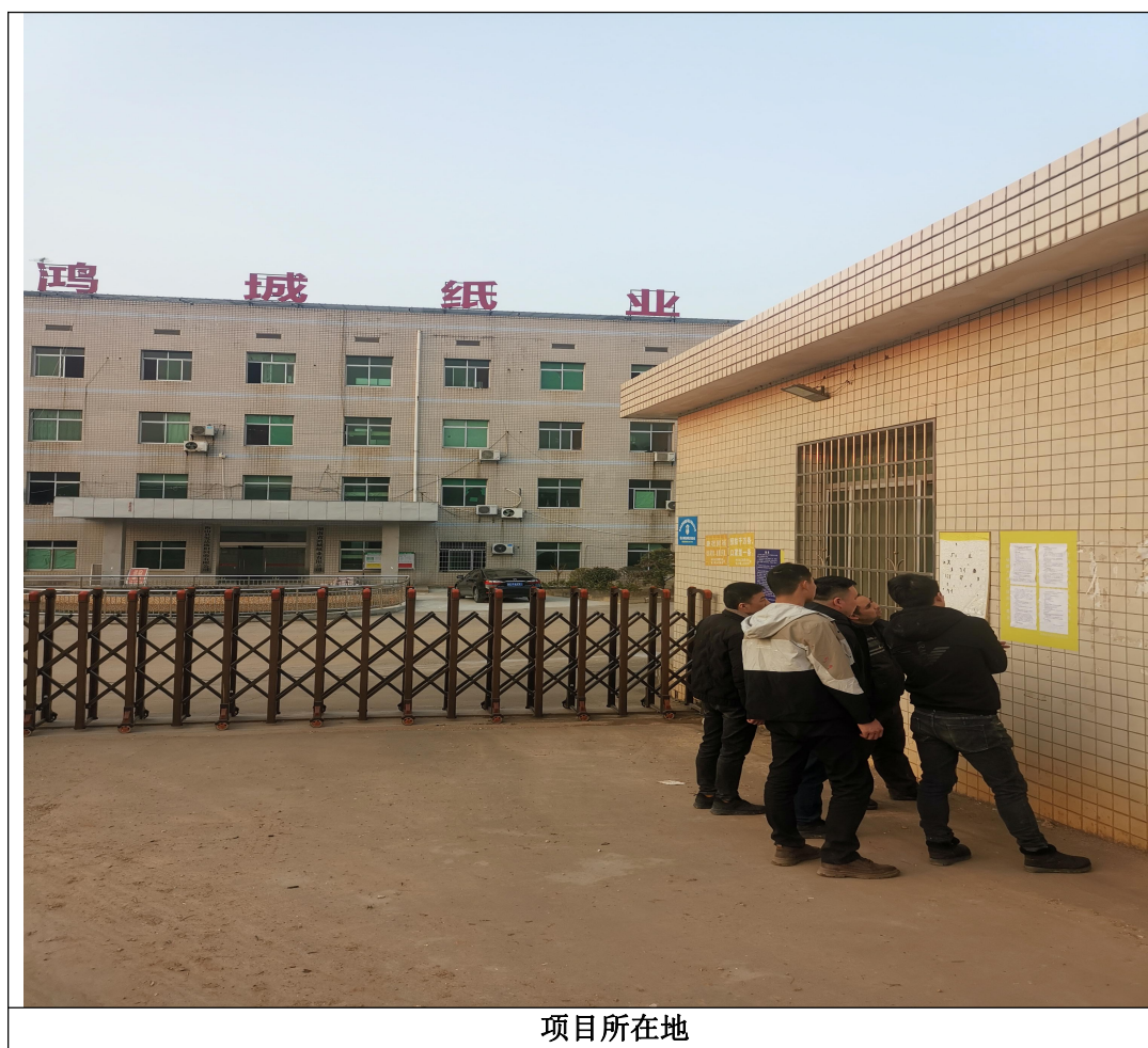
图 3-3 现场第二次公示