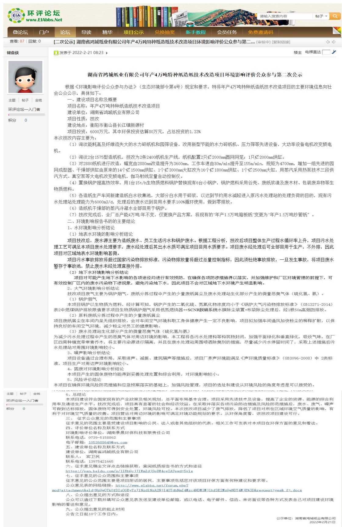
图3-1 第二次网站公示截图